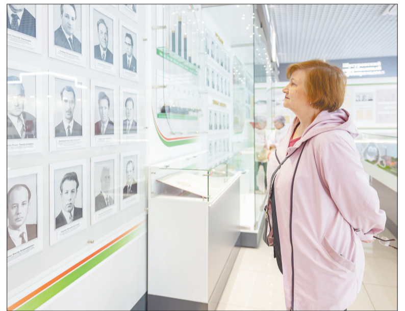
На стендах Музея нефти в Лениногорске созвездие имен, внесших большой вклад в развитие нефтяной отрасли республики