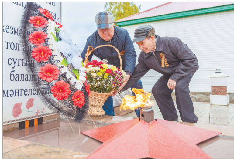
Возложение цветов к обновленному памятнику героям Отчизны в селе Верхние Чершилы

В селе Верхние Чершилы после реставрации открылся памятник героям Отчизны