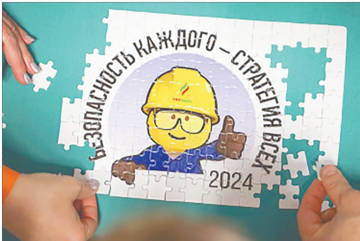
Геймификация - эффективный способ организации обучения

— Еще раз настраивай себя на то, чтобы на рабочем месте неукоснительно соблюдать требования охраны труда, предотвращать правонарушения у своих коллег, — делится он.