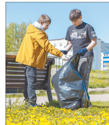
На территории водоема по пр. 50 лет Победы убрались ученики СОШ № 7