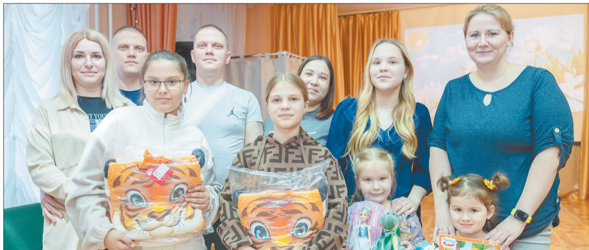
Выпускники Лениногорского детского дома вместе со своими детьми пришли на встречу в детский дом

На мелькающих на экране кадрах – они еще дети, со старанием помогают обустроить будущий корт, сажают деревья, корпят над грядками, выпекают блины. Мгновения детства со старого альбома вызывают умиление и восторг. Спустя годы, в преддверии Международного дня семьи, на первую встречу выпускников бывшие воспитанники Лениногорского детского дома пришли уже со своими детьми, с цветами для воспитателей и сладкими подарками для воспитанников учреждения.