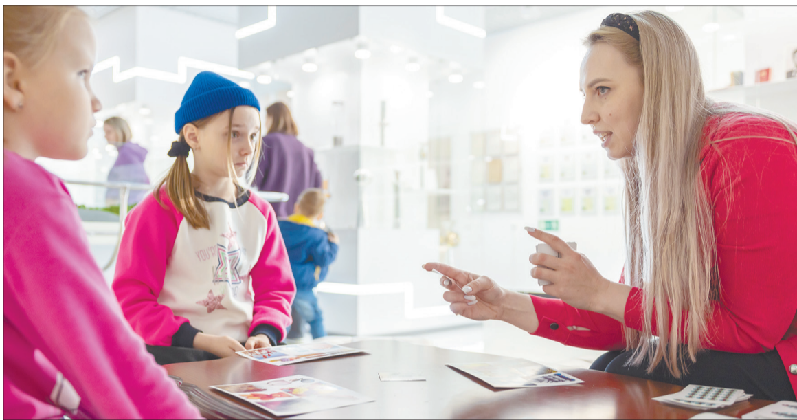
Самые юные посетители Музея нефти в Лениногорске искали пару для карточек по нефтяной тематике

Музейный комплекс Компании «Татнефть» присоединился к акции «Ночь музеев»